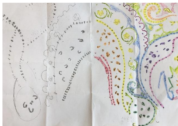
1_žáci při tvorbě zrcadlové dokresby; 2_ukázka dokresby