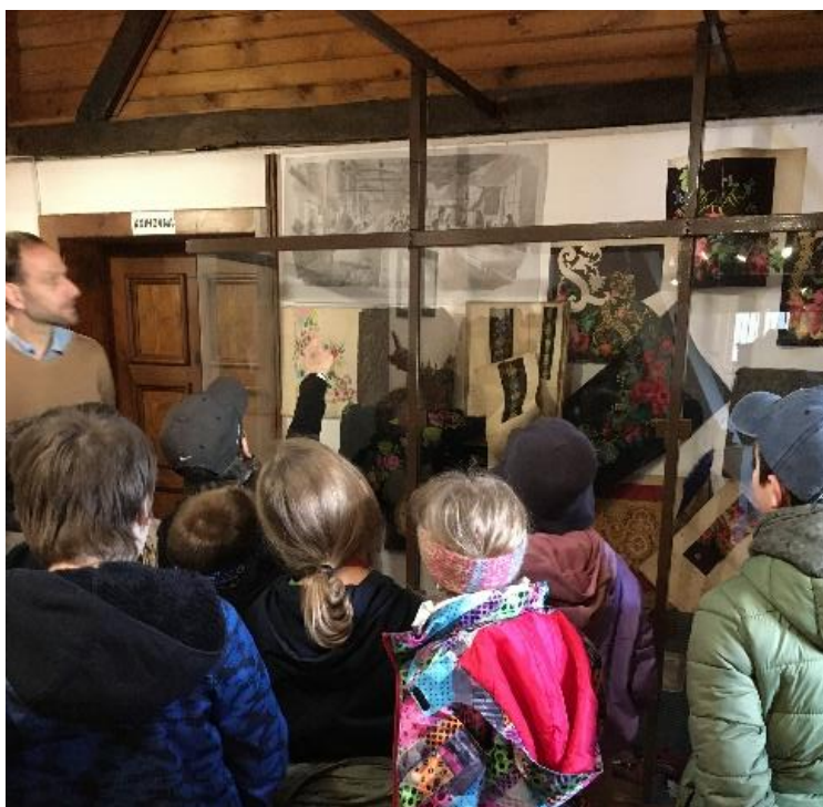
Žáci u vitríny s barvenými látkami.