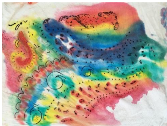
1_žáci při malbě na látku; 2_ukázka malované látky