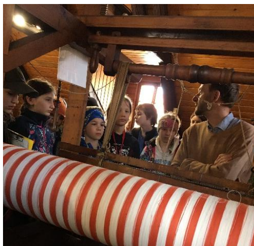
Ukázka fungování tkalcovského stavu v semilském muzeu.